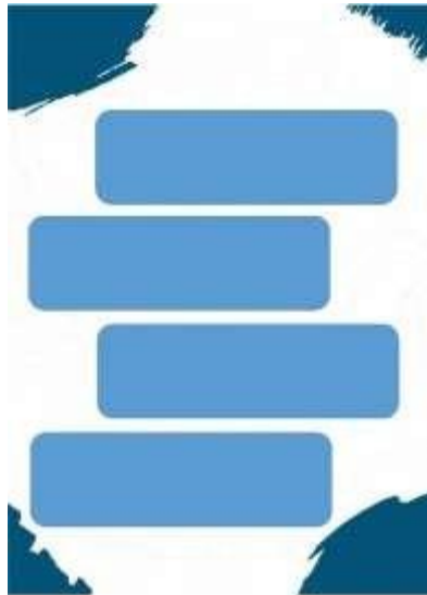
Gambar 2. Lembar Instrumen Halaman 2