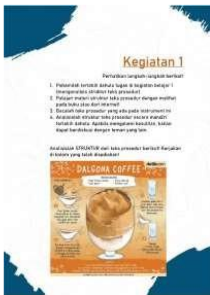
Gambar 1. Lembar Instrumen Halaman 1