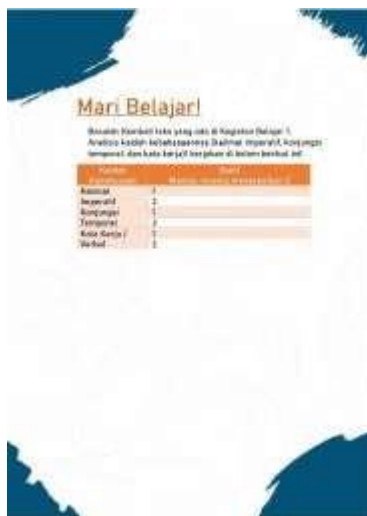
Gambar 4. Lembar Instrumen Halaman 4