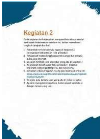
Gambar 3. Lembar Instrumen Halaman 3